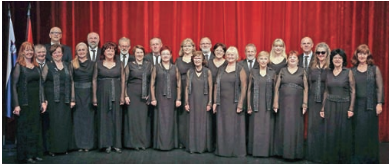
MePZ Anton Tomaž Linhart Radovljica

ustvarjalno delo na področju kulture in kulturne dediščine v Kropi ter Mladinski pevski zbor Navdih ob desetletnici delovanja.