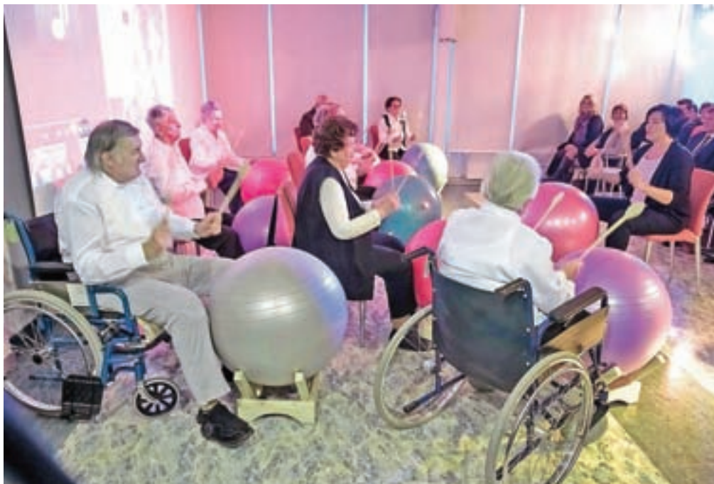
Na prireditvi so nastopili tudi stanovalci doma.

Kot pravi Resmanova, se v domu že dolgo zavedajo, kako pomemben del družbene stvarnosti so najstarejši med nami. "Naša življenjska doba je vse daljša, zavedamo se velikega pomena, ki ga imata skrb za zdrav način življenja ter