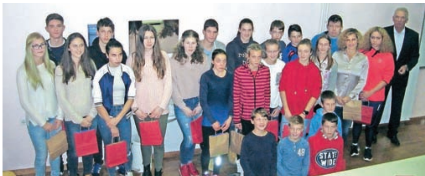
Dobitniki medalj na državnih prvenstvih in atletskih pokalih