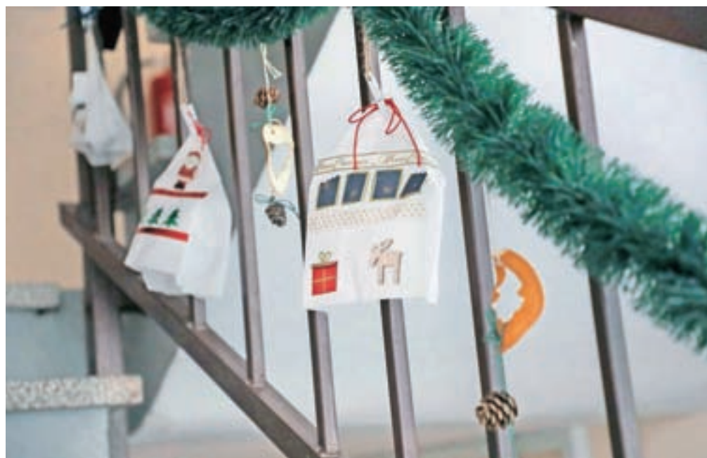
Navadne papirnate vrečke je spremenila v pravljice hišice in z njimi okrasila stopnišče v bloku.

"Prvo leto sem uporabila okraske, ki smo jih izdelali