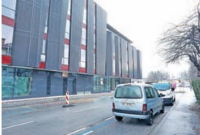
V sklopu nove knjižnice bo za uporabnike na voljo tudi okoli 80 parkirnih mest.